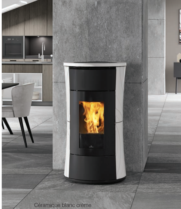
Céramique blanc crème