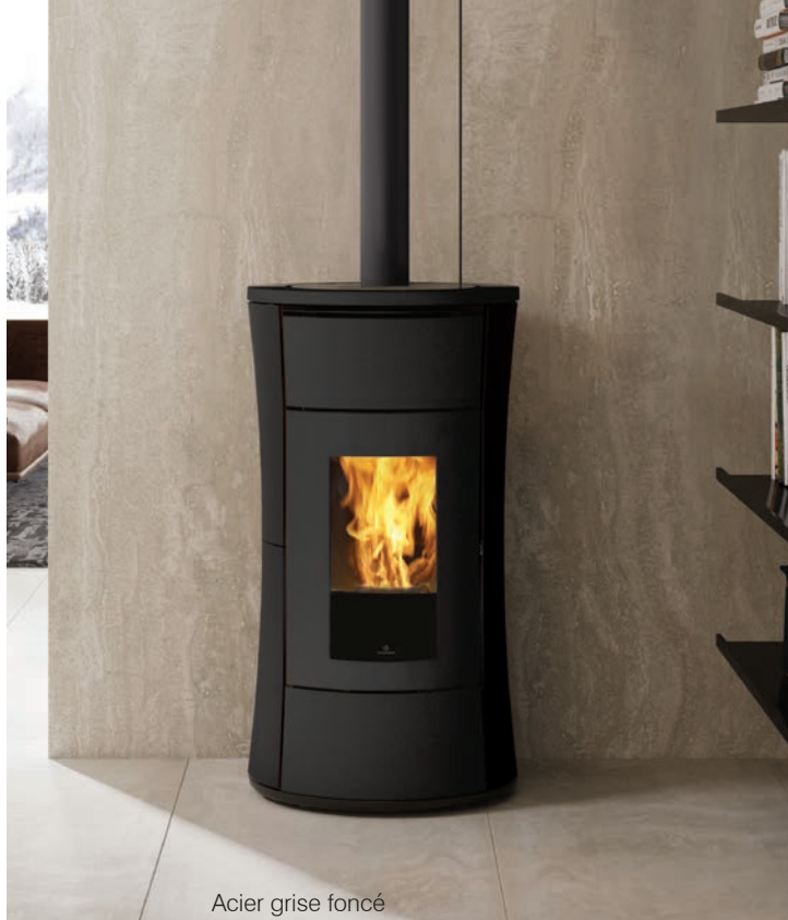
Acier grise foncé